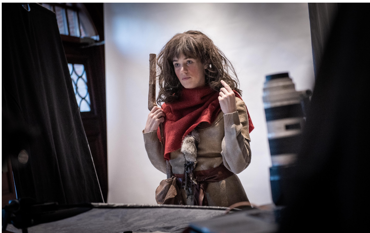
Fotoshoot til Odense Teaters sæsonkatalog. Billedet bliver taget et helt år før forestillingen har premiere så det kan godt være at Ronja ser helt anderledes ud, når du skal se forestillingen.

I sidste fase foregår evalueringen af forløbet i form af, at eleverne skal simulere, at de er Skalde-Per, der skriver et brev til Ronja og Birk. Formålet med sidste del i undervisningsmaterialet er en bearbejdning og videredigtning af forestillingen og skriftliggørelse af den enkelte elevs fortolkning af forestillingen. Eleverne foreholdes her forestillingen som en fortælling om udvikling fra barn til voksen.