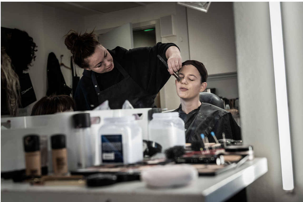
Skuespillerne møder ind et par timer før forestillingen for at få lagt make-up, ordnet håret og varme op.