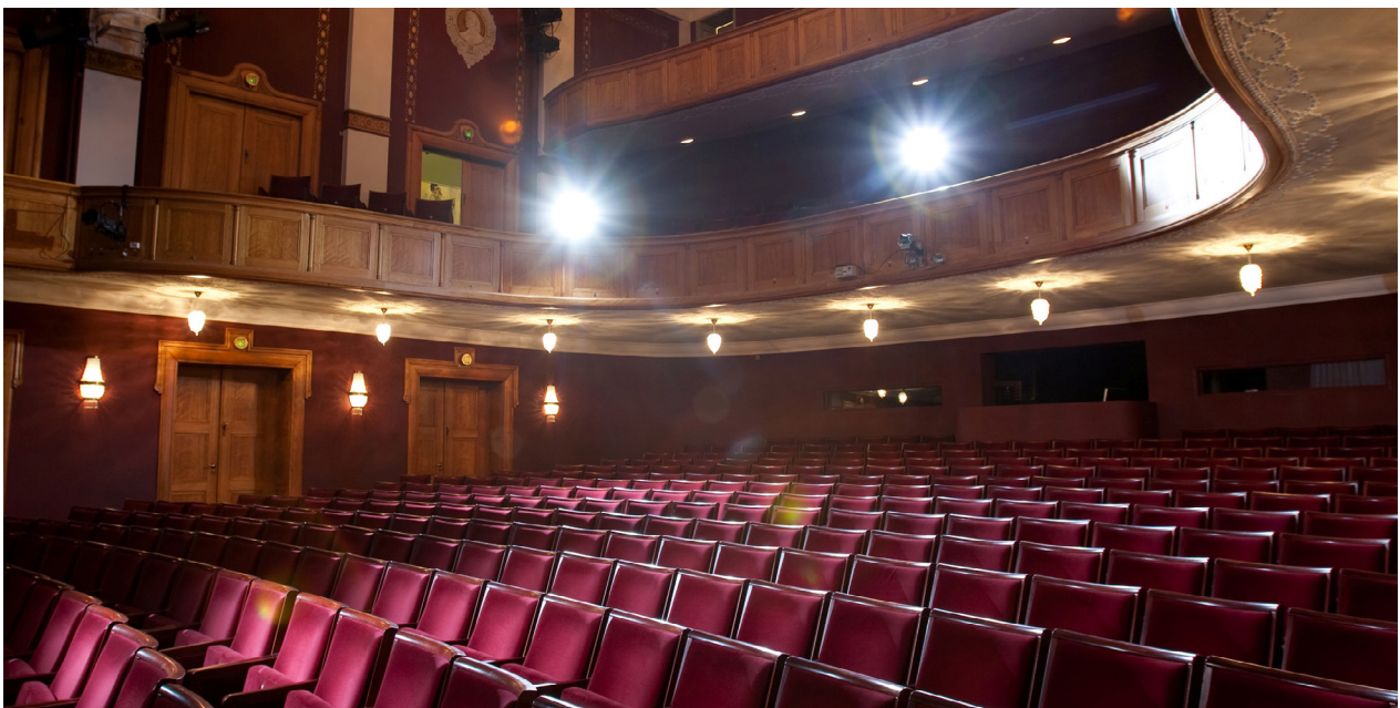
Ronja Røverdatter skal spille på Odense Teaters Store Scene, hvor der er plads til 483 tilskuere.

Når I har bygget kulissen, skal I præsentere den for klassen. I skal forklare klassen, hvorfor I lavet en kulisse af Mattisskoven, som I har. Du skal sammen med din læsemakker sætte ord på, hvad Mattisskoven betyder for Ronja og Birk. Måske overvejer du samtidig, hvad skoven betyder for dig.