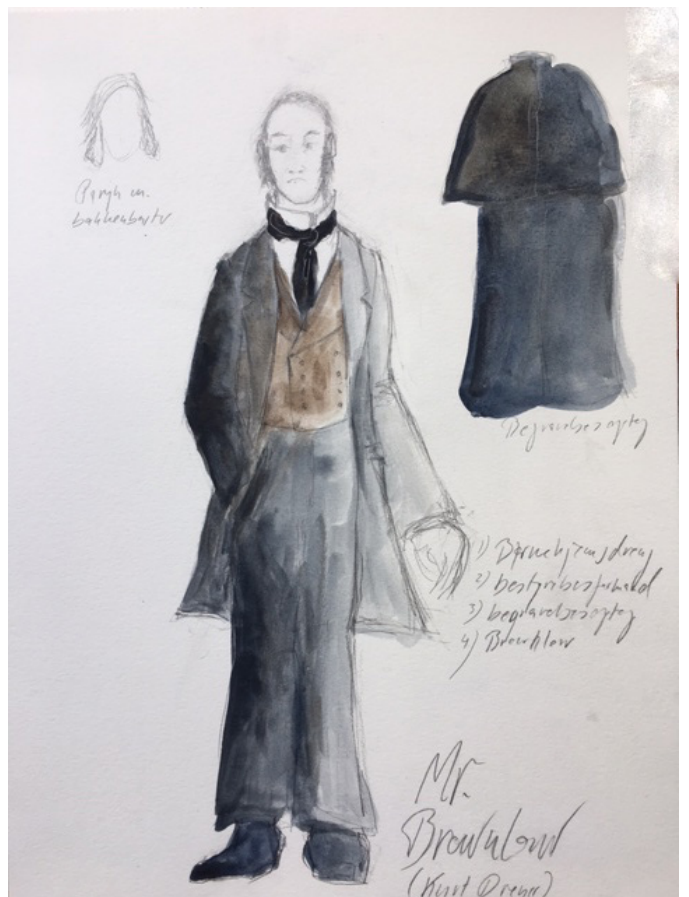
Kostumetegningerne vises med venlig tilladelse af Catia Hauberg Engel.