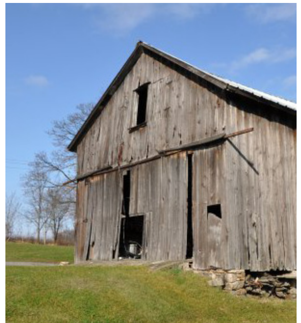
Typisk polsk lade