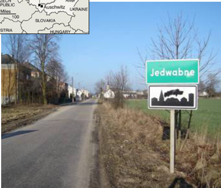
Byskilt ved indkørsel til Jedwabne