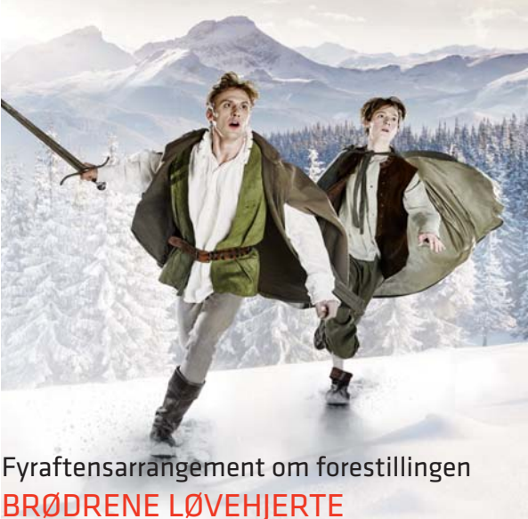
Fyraftensarrangement om forestillingen BRØDRENE LØVEHJERTE

Få inspiration og gode idéer til arbejdet med BRØDRENE LØVEHJERTE i undervisningen. Hør om Astrid Lindgren og hendes bøger. Få idéer til hvordan emner som død og sorg kan komme i børnehøjde. Få idéer til hvordan du kan bruge dramaøvelser til at få historien og teateroplevelsen ind i kroppen på dig og dine elever.