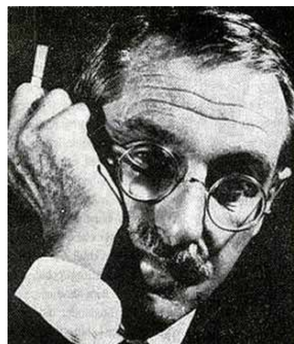
Dramatiker Jean Anouilh (1910-1987)