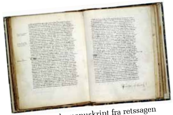
Det originale manuskript fra retssagen mod Jeanne D'Arc