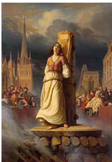
”Jeanne d’Arc på bålet”. Maleri fra 1843 af Herman Stilke.

Øjenvidner berettede, at Jeanne d’Arc blev bundet til en høj pæl på det gamle torv i Rouen. Hun bad om at få holdt et krusifiks foran sig. Det blev hende nægtet, men en engelsk soldat rakte hende et.