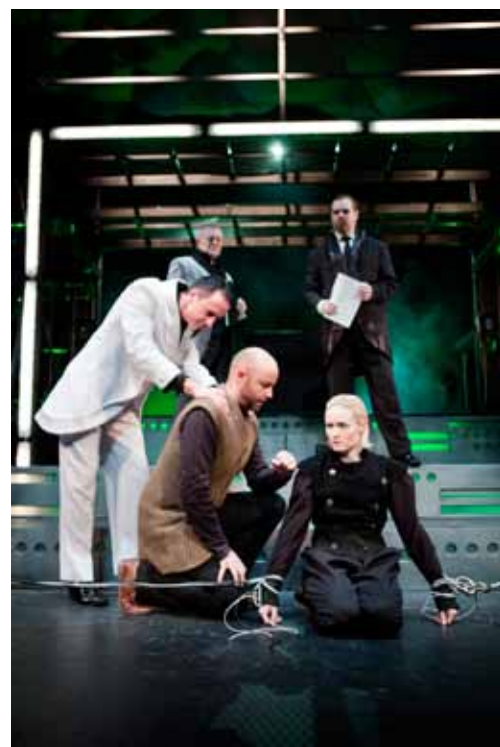
PR-foto fra forestillingen.

Finally, having accomplished all the preceding, We appointed the said Jeanne to appear the next day, at 8 o’clock in the morning, before Us in the Ornament Room, at the end of the Great Hall of the Castle of Rouen.