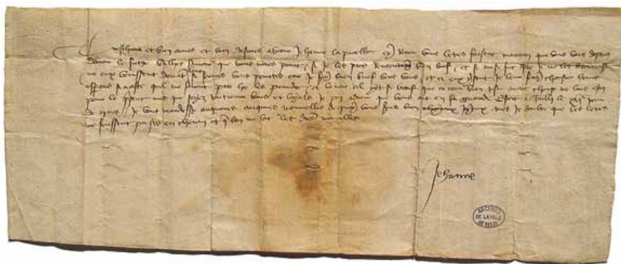
Jeanne's brev til indbyggerne i Rheims 16. juli 1429. (Det er Jehannes egen underskrift).

Jeanne D'Arc blev født 1412 i Domremy i Lorraine i Frankrig