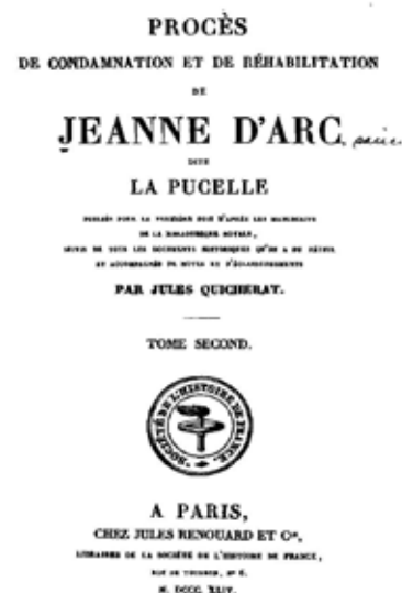
Titelbladet fra Jules Quicherat, Procès de Condamnation et de Réhabilitation de Jeanne d'Arc , Paris 1841-49 (digitaliseret udgave).

After this oath, Jeanne was interrogated by Us as to her name, and surname, her place of birth, the names of her father and mother, the place of her baptism, her godfathers and godmothers, the Priest who baptized her, etc.