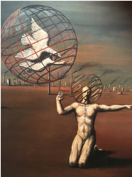
Edgar Ende In den Kugelen 1932

Det vil være godt at tale med eleverne omkring det at være fanget i andres opfattelse af én blandt andet ud fra billeder.