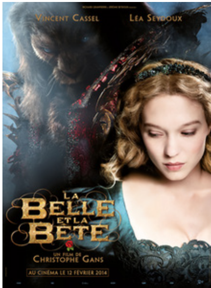
Fransk/tysk filmatisering fra 2014 af Christophe Gans og Richard Grandpierre