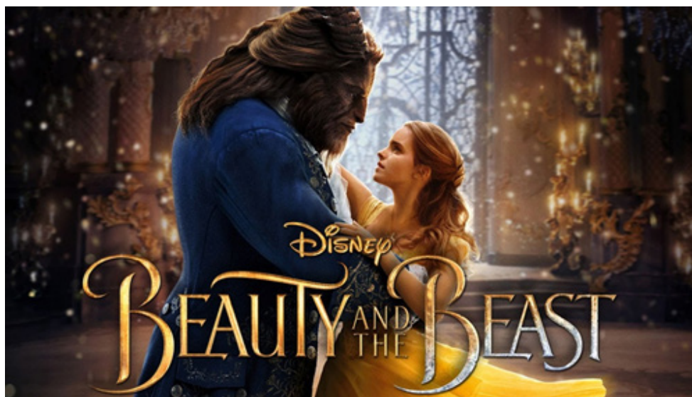
Walt Disney's film fra 2017 med Emma Watson som Skønheden