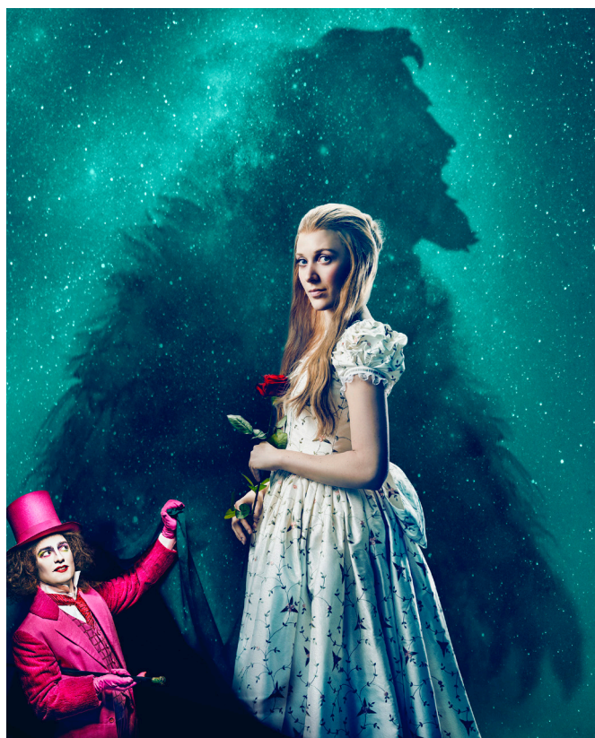
Odense Teaters ikonfoto til forestillingen Skønheden og Udyret