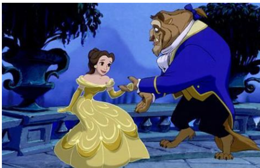
Walt Disneys tegnefilm fra 1991