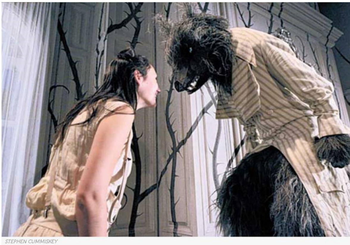
Forestillingsfoto fra forestillingen Skønheden og Udyret af Lucy Kirkwood og Katie Mitchell på National Theatre