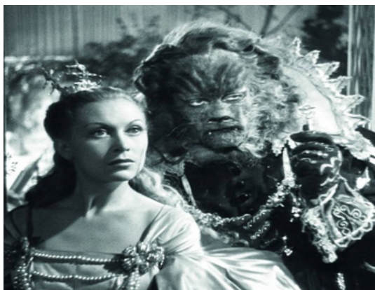
Den første filmatisering af La Belle et la Bête er den franske film fra 1946 af Jean Cocteau.

Her følger et par eksempler på de utallige produktioner, der findes af La Belle et la Bête , Beauty and the Beast eller Skønheden og Udyret .