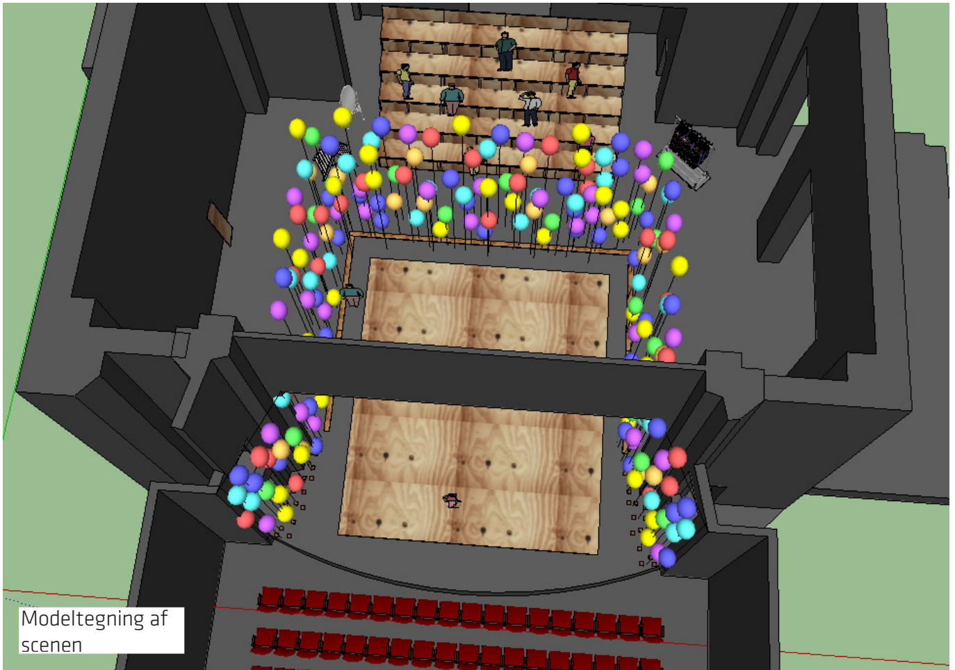
Modeltegnning af scenen